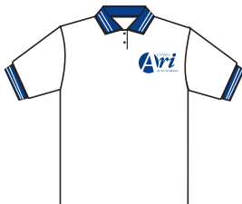
Camisa de malha branca – Gola e punho azul-marinho com DUAS listras brancas.