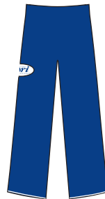
Calça em helanca azul-marinho com etiqueta bordada.