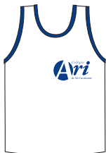
Camiseta de malha branca com debrum azul-marinho no decote e nas cavas.