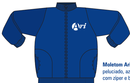
Moletom Ari de Sá peluciado, azul-marinho com zíper e bolsos.