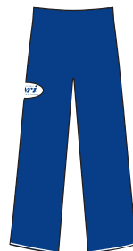
Calça em helanca azul-marinho com etiqueta bordada.

O Colégio Ari de Sá vende o uniforme nas Lojas Ari de Sá , localizadas nas suas sedes. A Escola credencia, também, a loja Juarez Leitão Uniformes .