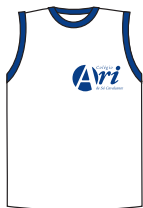
Camiseta de malha branca com debrum azul-marinho no decote e nas cavas (modelo-padrão).