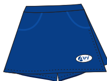
Short-saia em helanca azul-marinho com etiqueta bordada (modelo-padrão). *Obs.: mesmo short-saia das demais aulas.