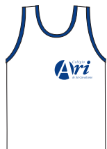
Camiseta de malha branca com debrum azul-marinho no decote e nas cavas (modelo-padrão).