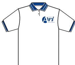
Camisa de malha branca – Gola e punho azul-marinho com UMA listra branca.