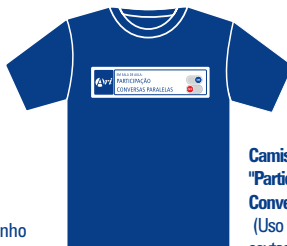
Camisa da Campanha "Participação ON, Conversas Paralelas OFF" (Uso opcional, às sextas-feiras).

Obs.: É opcional o uso do moletom pelos alunos, desde que no modelo oficial da Escola.