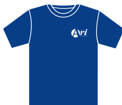
Camisa de malha azul-marinho com mangas.