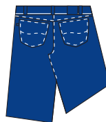
Calça masculina: – Brim cotton lycra azul-marinho Santista. (Ref.: 3870-104-32-J95)

TÊNIS OU SAPATOS NAS CORES PRETA, BRANCA, AZUL OU CINZA, PREDOMINANTEMENTE, E MEIAS BRANCAS.