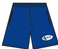
Short em helanca azul-marinho com etiqueta bordada (modelo-padrão). *Obs.: mesmo short das demais aulas.