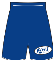
Short em helanca azul-marinho com etiqueta bordada.