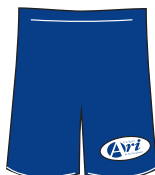
Short em helanca azul-marinho com etiqueta bordada.