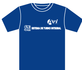
Camisa de malha azul com mangas (opcional).